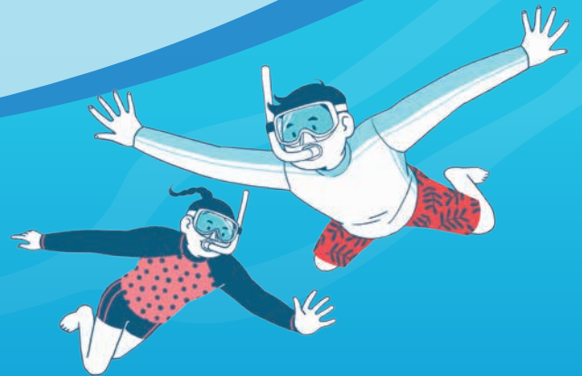
드넓은 바닷속을 관찰하는 스노클링

마스크와 스노클을 착용하고 수면 위에 떠서 바닷속을 관찰하는 활동이다. 수영이나 잠수 기술이 없어도 수중 생태계를 가까이 볼 수 있어 초보자도 부담 없이 도전 가능하다.