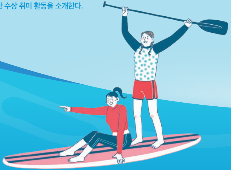
잔잔한 수면 위를 나아가는 패들보드

넓은 보드 위에 타서 노를 저으며 나아가는 수상 레저다. 물 위를 산책하듯 이동할 수 있어 운동과 힐링을 동시에 즐길 수 있으며 균형 감각과 코어 근육 강화에도 도움이 된다.