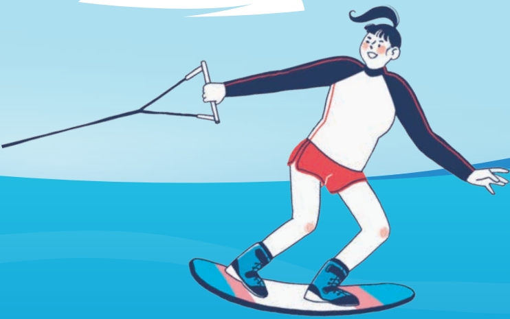
물 위를 빠르게 질주하는 수상스키

보트가 끄는 줄을 잡고 물 위를 미끄러지듯 달리는 대표적인 여름 스포츠다. 시원한 물살을 가르며 속도감을 즐기기가 좋다. 기본자세를 익히면 비교적 빠르게 재미를 느낄 수 있다.