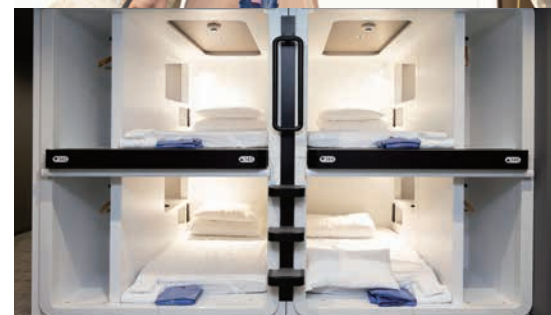
이코노미 클래스 객실