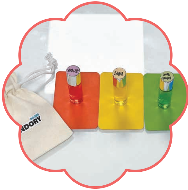
삼양사 풍세물류센터 정지현 님