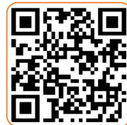
* 회원가입 QR코드