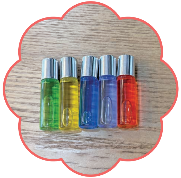
메리어트 호텔 여의도 김경희 님