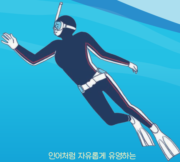
인어처럼 자유롭게 수영하는 프리다이빙

무더운 여름이 오면 시원한 물가가 절로 생각난다. 단순히 더위를 식히는 것을 넘어 물에서 새로운 취미를 만들어 보면 어떨까. 여름에 도전하기 좋은 다양한 수상 취미 활동을 소개한다.